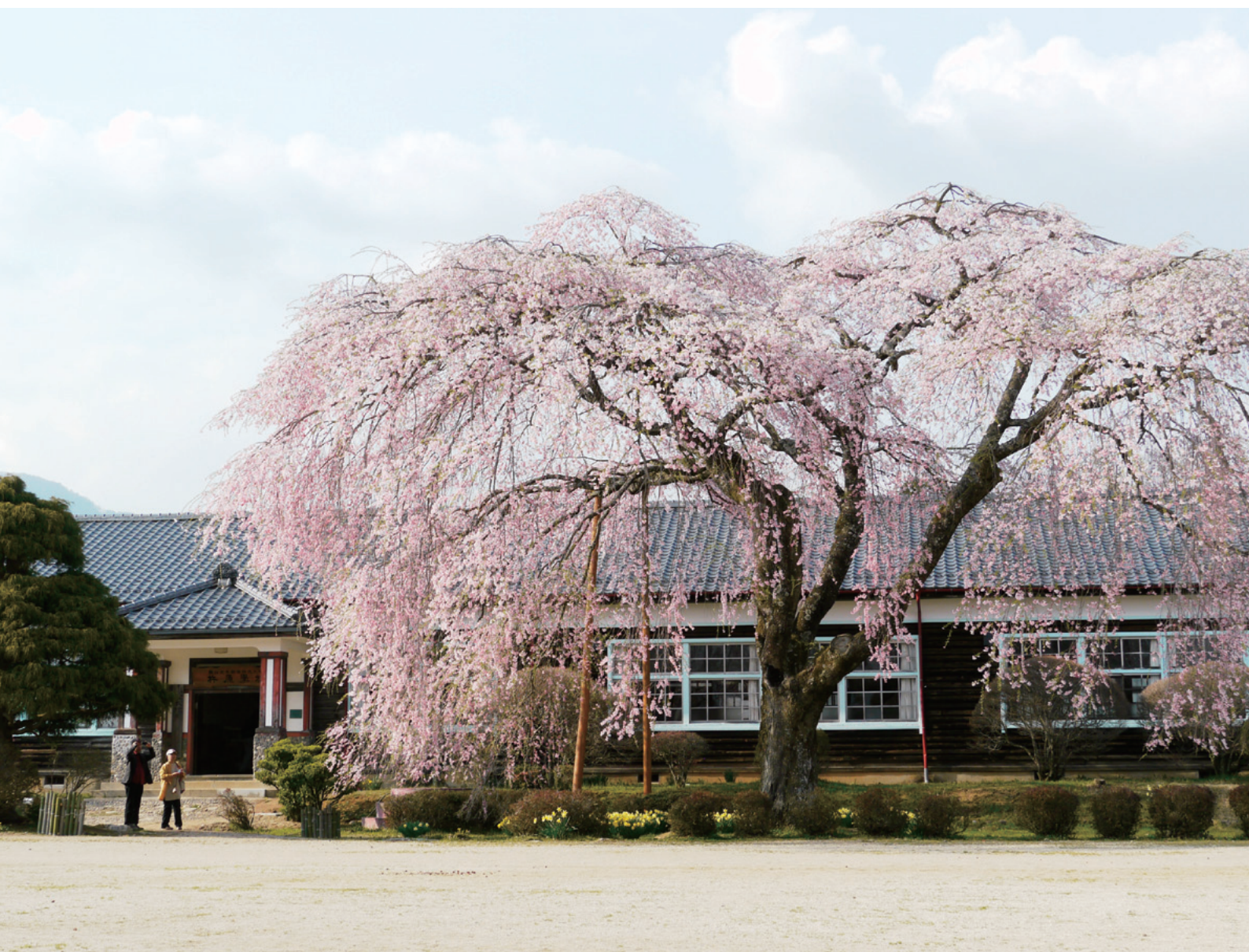
Photo : 飯田市竹佐 杵原学校の桜